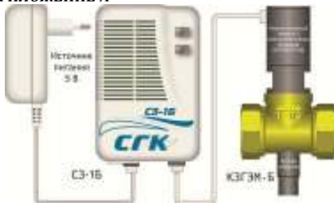
Рис. А1. Система СГК-1-х-Б с клапаном типа КЗГЭМ-Б.